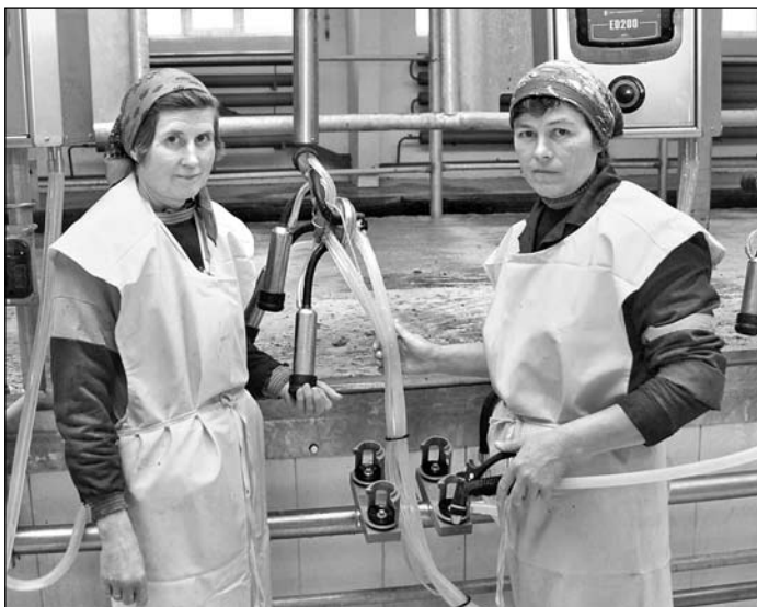
Дойка на комплексе КСУП «Баршчоўскі»

Наталля ВАСІЛЬЕВА