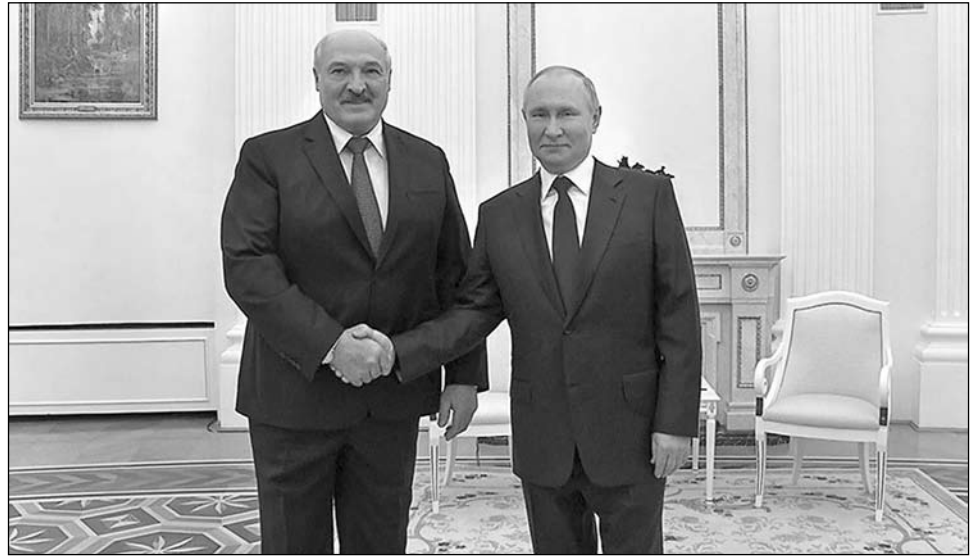
Александр Лукашенко и Владимир Путин

«Последний раз мы договорились, что серьезно в Минске поработают наши правительства. Благодарю вас, Михаил Владимирович (премьер-министр России Михаил Мишустин, который недавно посещал Беларусь во главе российской делегации. – Прим. БелТА) приехал, выступил, как ака-