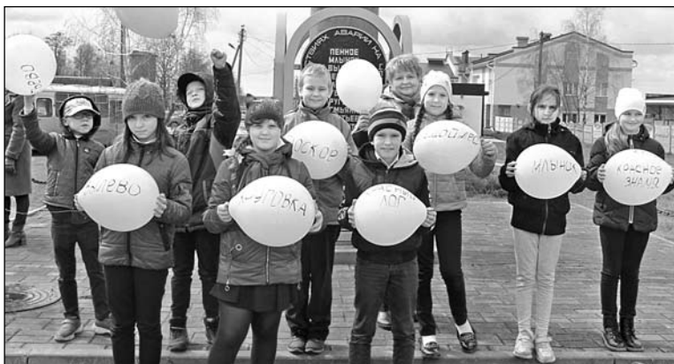
Об аварии школьники знают от учителей, библиотекарей, родителей