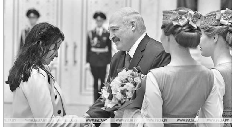
Во время церемонии вручения наград

Обращаясь к представительницам прекрасного пола, глава государства обратил внимание на несоизмеримо высокую роль женщин. «Судьбой определено, что предназначение мужчины – защищать. В то время как предназначение женщины – быть хранительницей очага, семейных ценностей и национальных традиций», – сказал он.