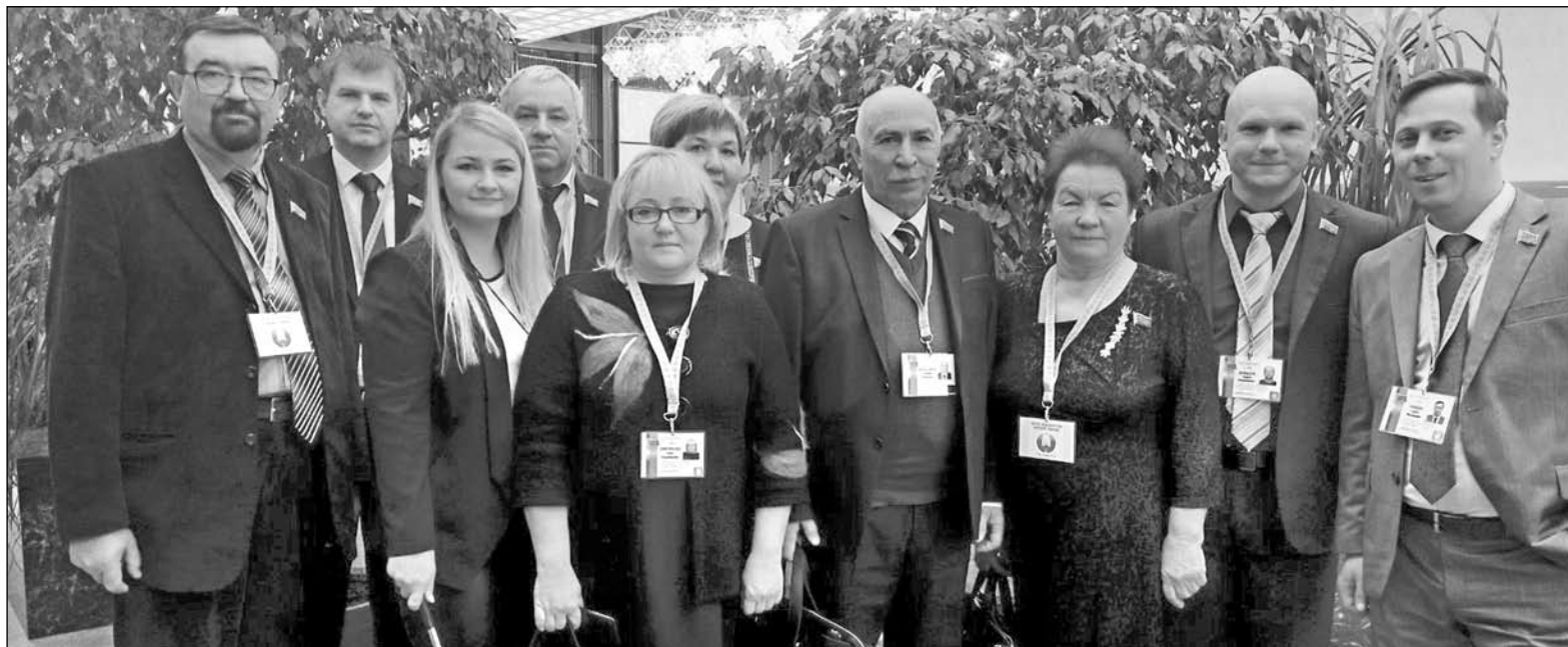
Делегация Добрущины накануне итогового дня форума

Обращаясь к участникам народного вече, Глава государства отметил: «...Настоящее и будущее Беларуси – в наших руках, и прежде всего в руках присутствующих здесь делега-