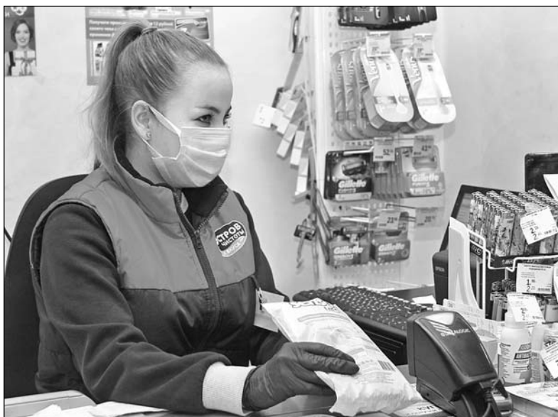
Защитные маски газетчики приобрели в одном из магазинов города

К слову, эта мера профилактики практикуется в медучреждении с начала пандемии и никак не связана с введением масочного режима. Да и люди уже привыкли к требованиям медиков. Чего не скажешь о