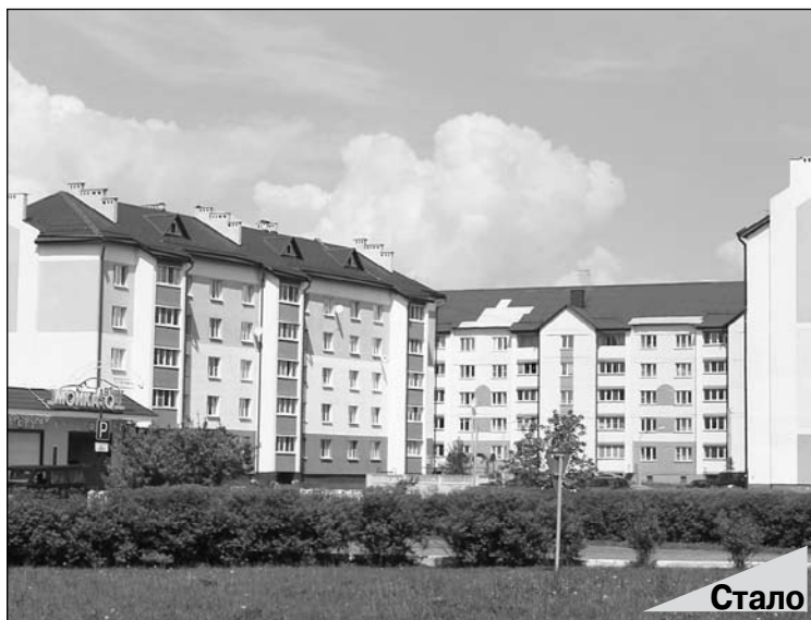
Микрорайон Мелиоратор сегодня

производств, многоквартирных и индивидуальных жилых застроек, для новых улиц и дорог.