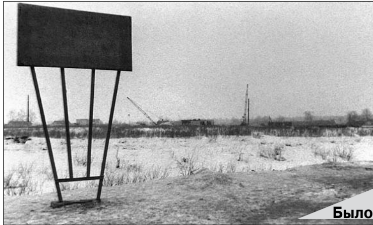
Район СМУ, 1981 г.

Картина начала меняться благодаря реализации плана генерального развития города Добруша, рассчитанного на несколько десятилетий. В документе учтены демографическая и экологическая ситуации, места для строительства новых