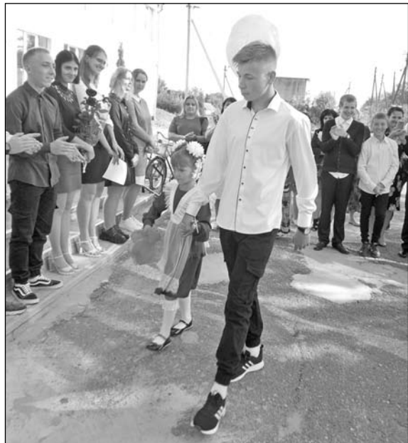
Звучит первый звонок

(Окончание — на 5 с.)