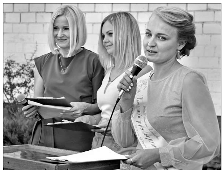
Слова напутствия от классного руководителя