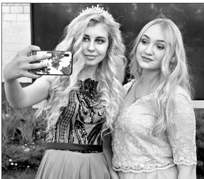
Селфи на память