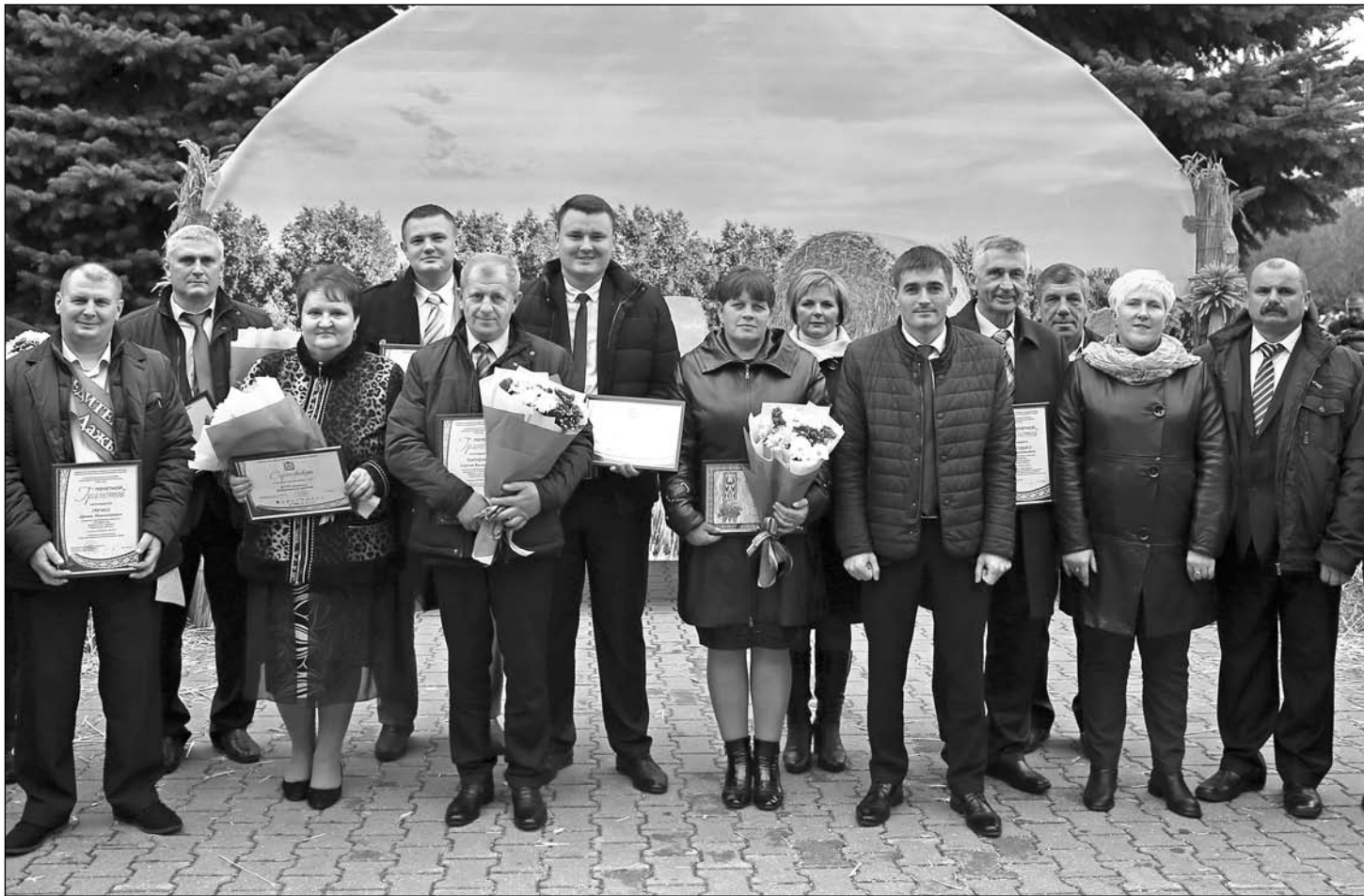
Прадстаўнікі дэлегацыі Добрушчыны на «Дажынках – 2019»

Лепшых аграрыяў ушаноўвалі ў мінулую пятніцу на абласным свяце «Дажынкi – 2019» у Рэчыцы